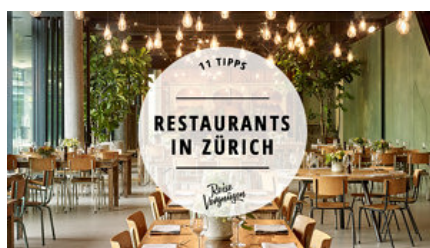
Restaurants in Zürich – Die 11 besten Orte zum Essen und Trinken