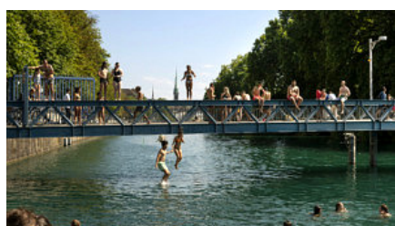
Diese Nachtzüge fahren ab Zürich durch Europa