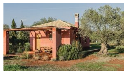
Nachhaltiger Farmstay in Griechenland – Zu Gast auf der Eumelia Organic Farm